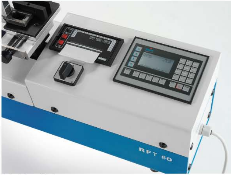
Bediendisplay und Drucker