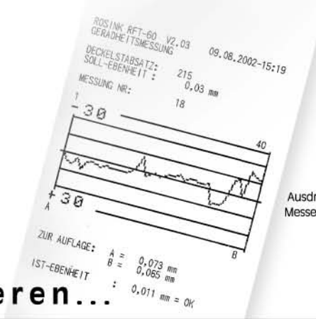
Ausdruck der Messergebnisse