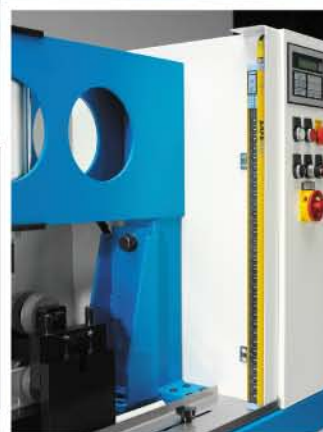
Durchbiegungskompensation und Lichtvorhang