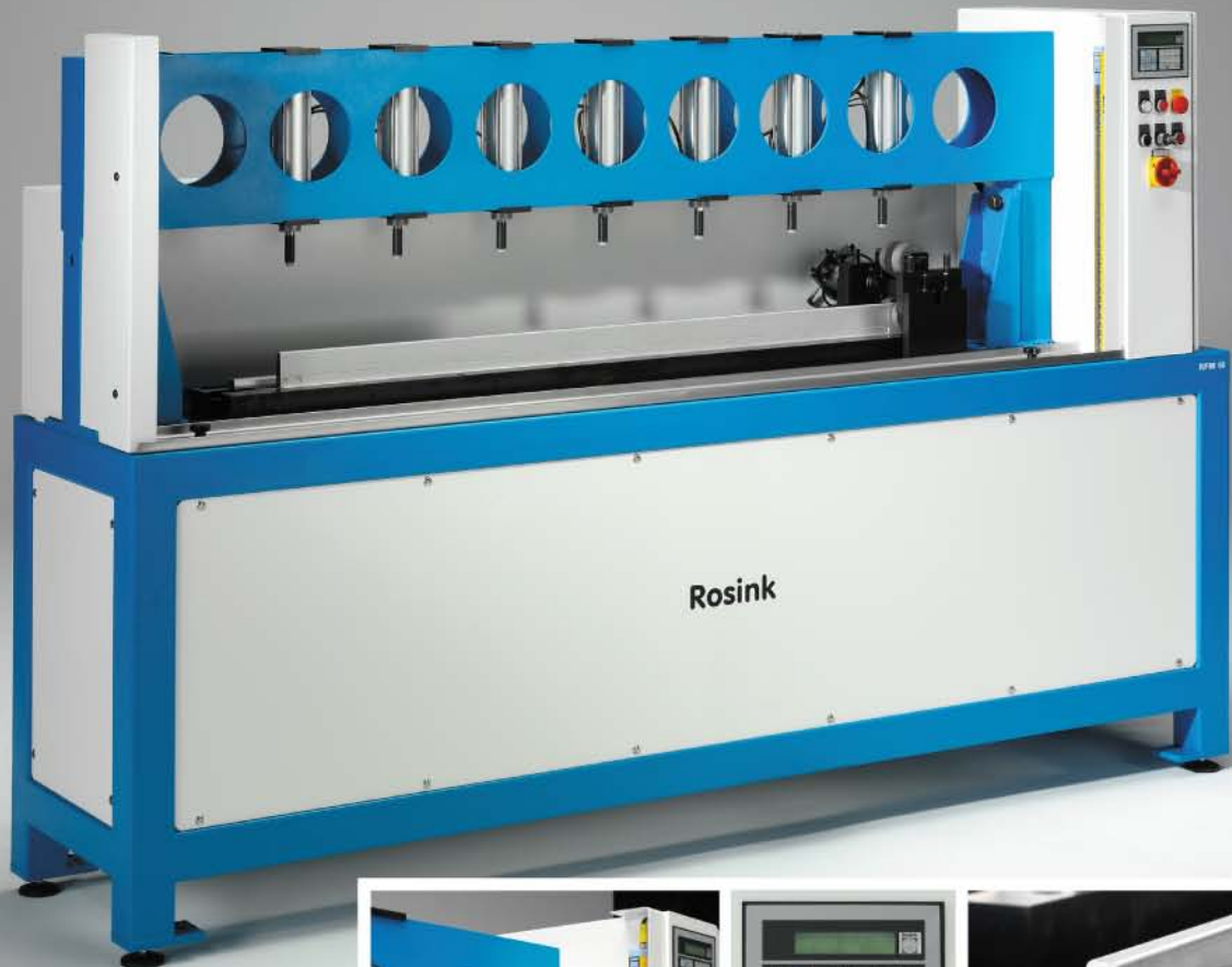
Dargestellt ist die RFM 60