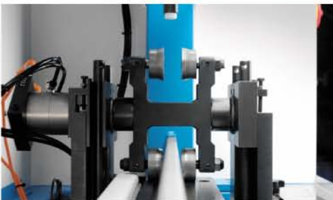
Vorbiegerollen im Einsatz