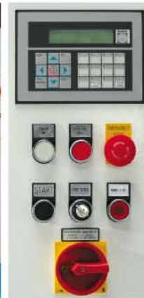
Display und Bedienelemente